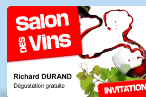
Invitations à vos événements