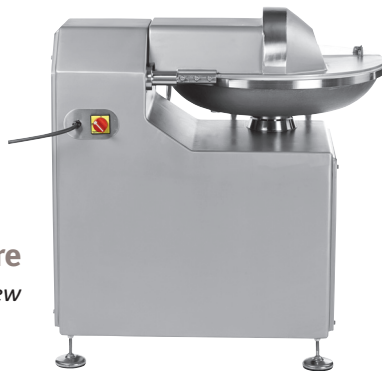
Vue arrière Rear view

* Titane 45 with variator on the knife motor.