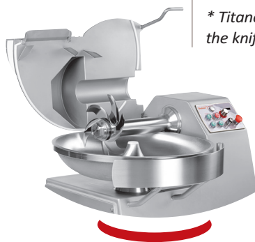
Finition parfaite angle arrondi Perfect completion round angles