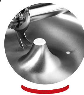
Bouchon pour vidange de la cuve Plug for the unloading of bowl