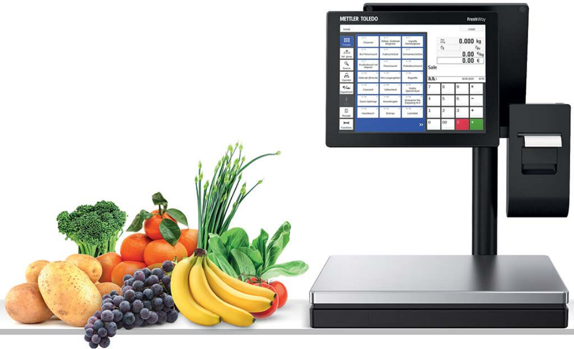
FreshWay avec afficheur sur colonne

FreshWay avec afficheur sur colonne est la nouvelle balance à écran tactile de METTLER TOLEDO. Elle répond aux exigences les plus poussées des commerçants ambitieux. FreshWay T combine un design récompensé avec une performance parfaite et définit de nouvelles normes de pesage et de service au client.